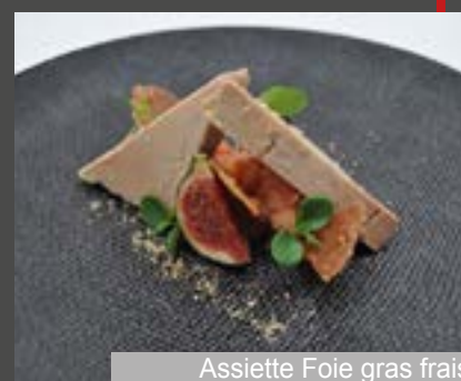
Assiette Foie gras frais