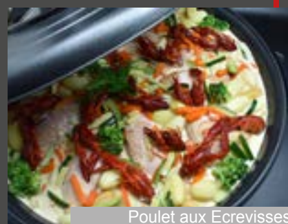
Poulet aux Ecrevisses