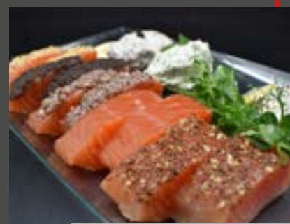
Déclinaison de Saumon fumé