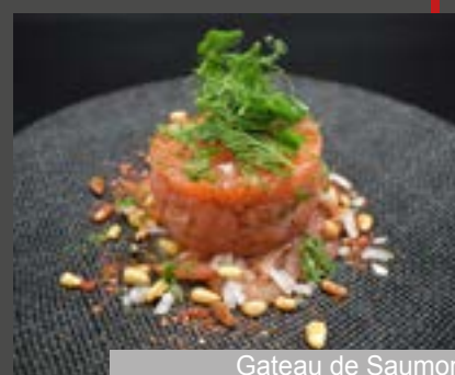
Gateau de Saumon