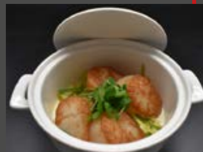
Casserolette de St Jacques

Nous avons sélectionné pour vous le «Royal Belgian Caviar» : 10 g - 16,04 € 30 g - 42,45 € 125 g - 165,09 €