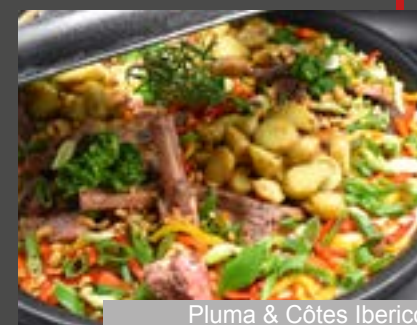
Pluma & Côtes Iberico