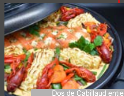
Dos de Cabillaud entier