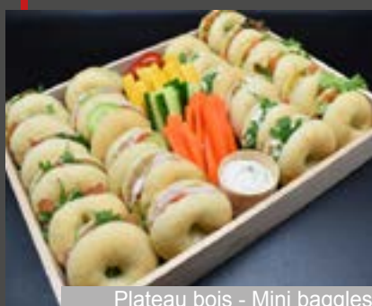
Plateau bois - Mini baggles