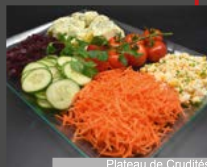
Plateau de Crudités