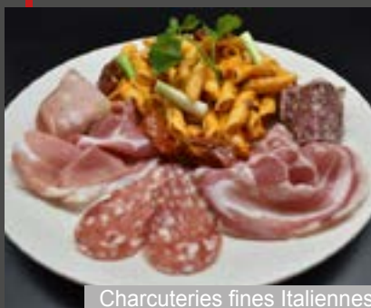
Charcuteries fines Italiennes