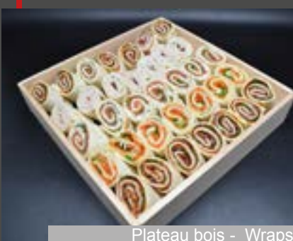
Plateau bois - Wraps