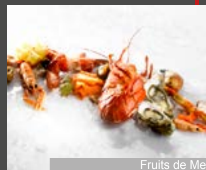
Fruits de Mer