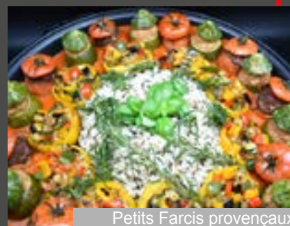
Petits Farcis provençaux