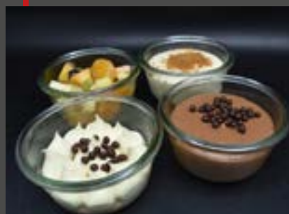
Bocaux 290 ml