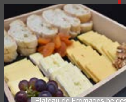
Plateau de Fromages belges