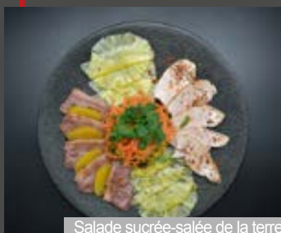
Salade sucrée-salée de la terre